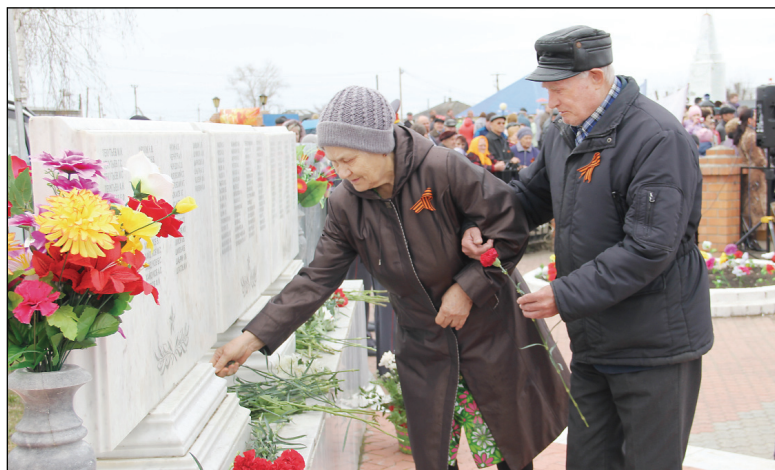
◆ С болью в сердце...