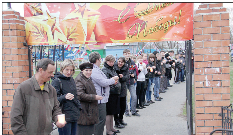
◆ Шествие огня победы.