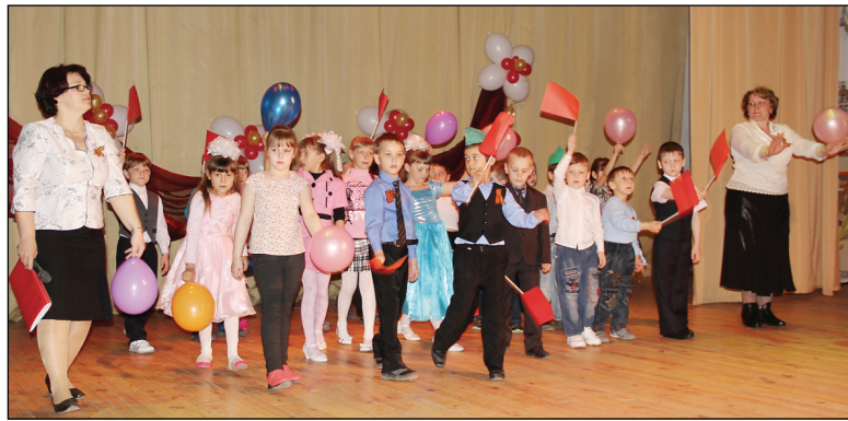
◆ Вас приветствуют юные таланты из детского сада «Сказка».