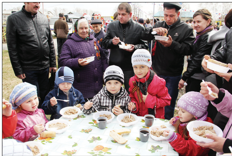
◆ Солдатская каша пришлась по вкусу всем – от мала до велика.