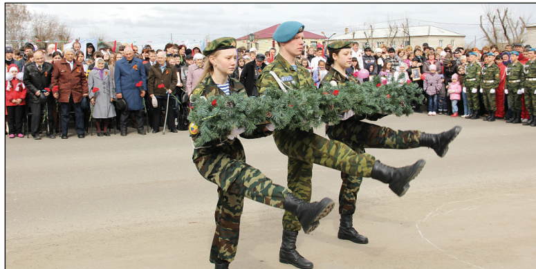
◆ Возложение гирлянды ребятами из кадетского класса.