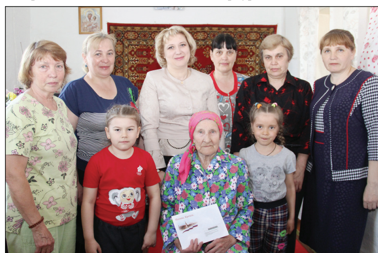
• Юбилярша в кругу семьи и гостей.