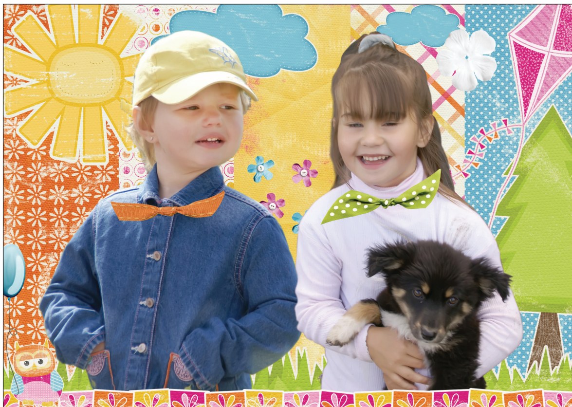
► Коллаж Ивана Горбунова.

Многие из нас помнят чувство детского счастья – начало летних каникул, начинающихся с праздника – Дня защиты детей. Будучи детьми, мы не понимали, кто кого и от кого должен защищать. Сегодняшнее юное поколение тоже не обеспокоено этими проблемами. Но ощущение праздника охватывает всех. Чистое голубое небо, летнее солнце, беззаботные маленькие человечки, рисующие цветными мелками на асфальте.