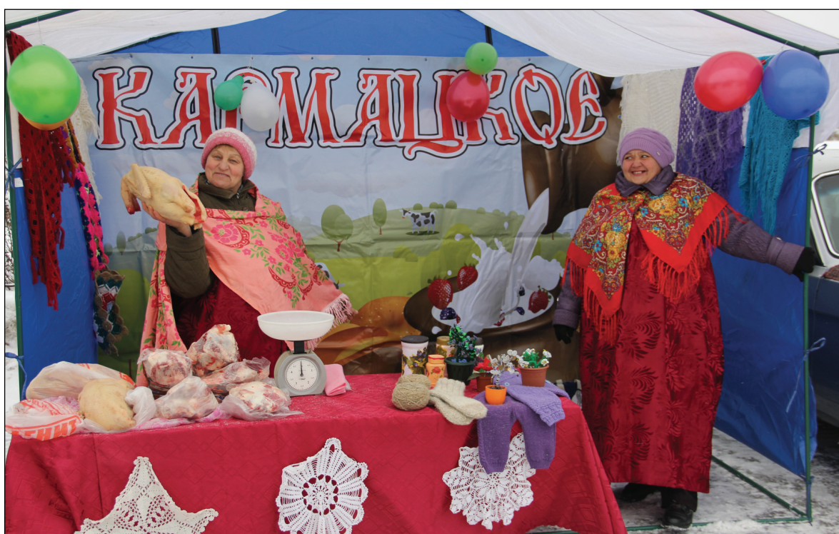
• Как и на подворьях остальных сельских поселений у жителей Кармацкой есть чем похвастать и что продать.

Громко распевая эти строки, ходили 7 ноября с лотками, полными различных яств, по площади села Аромашево, работники культуры, переодетые в костюмы скоморохов. В субботу в районном центре проводилась традиционная осенняя сельскохозяйственная ярмарка. День для проведения подобного мероприятия в плане погодных условий выдался удачным. С раннего утра аромашевцев к месту события завлекала льющаяся из динамиков весёлая музыка, и манил далеко разносящийся по округе запах готовящихся шашлыков.