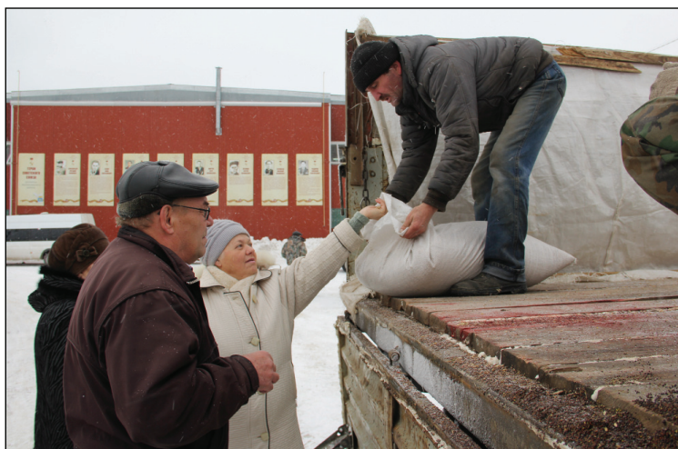
• Приобретаемый товар нужно проверить.

Нашлись здесь занятия и для тех, кто пришёл просто отдохнуть. Прекрасная культурная программа, различные развлечения и шашлык – всё было к услугам селян, посетивших ярмарку.