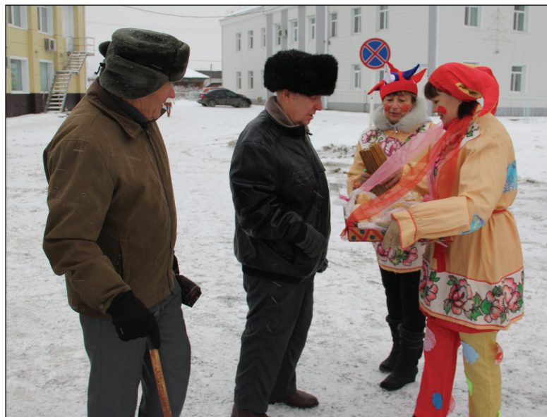
• Посетителей ярмарки развлекали скоморохи.