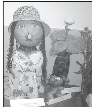
• «Сельская поп-дива» – творение второкурсников.

ВНИМАНИЕ! 3 ОКТЯБРЯ в РДК состоится выставка-продажа «ЭЛЛАДА-ШУБЫ» производства г. Пятигорска. Норковые шубы – новая коллекция! А также шубы из мутона, нутрии, бобра. Кредит без первоначального взноса до 3 лет!!! Возможна беспроцентная рассрочка до 10 месяцев!!! А также оплата кредитными, зарплатными банковскими картами!!! При себе иметь паспорт и второй документ.