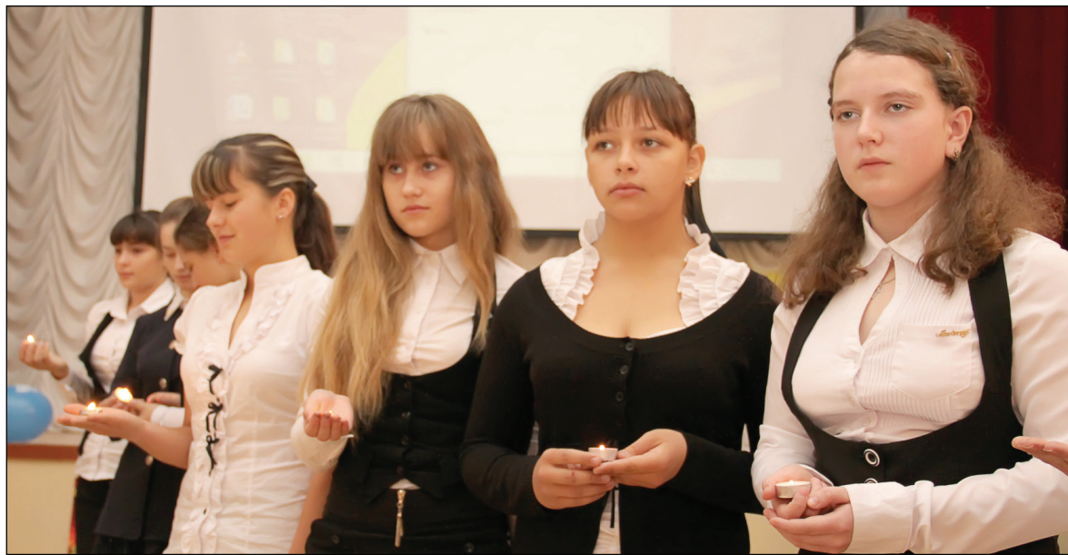
◆ Зажжение свечей в память солдатам Курской битвы.

Мероприятие завершилось зажжением свечей в память воинам-победителям и минутой молчания.