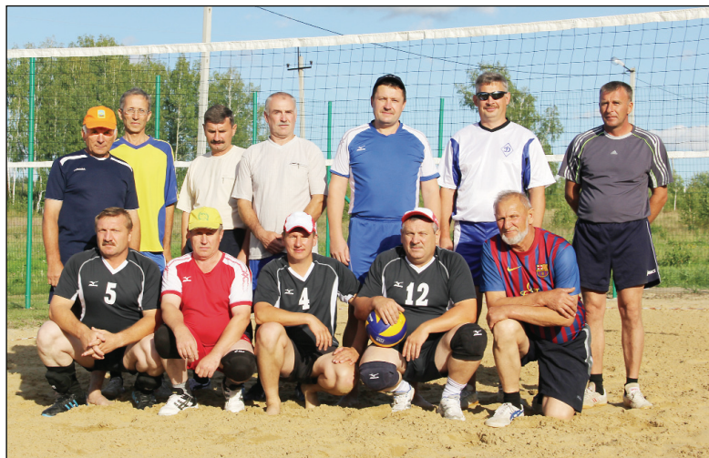
• Участники первого матча на новой площадке.