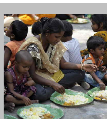
Индия - 2016

Индия - красивая, интересная, загадочная и не такая уж плохая страна.... Но всем индийцам, мне кажется, не помешало бы научиться толерантности.