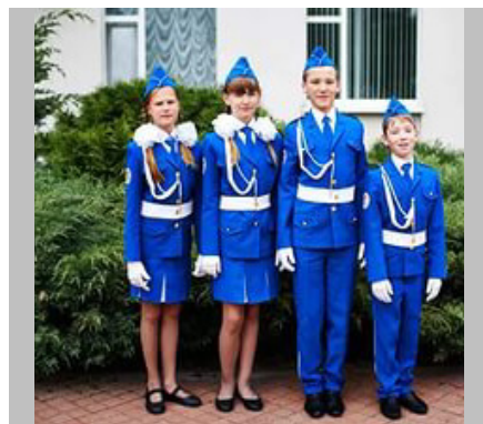
Норвегия - 2014