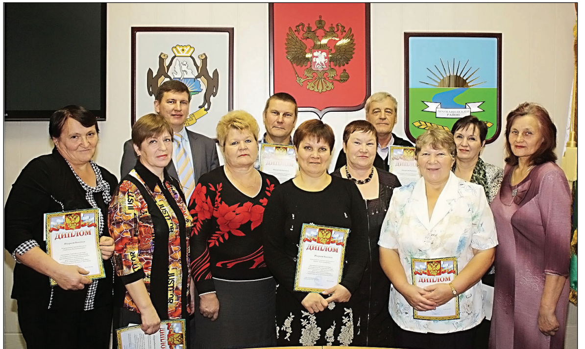
• Победители районного конкурса по благоустройству.

Наше настроение зависит от многих факторов, в том числе и от внешнего вида того населённого пункта, где мы живём. Всегда с радостью обращаешь внимание, когда после долгой зимы под лучами весеннего солнца на проталинах появляется зелёная травка, а в палисадниках распускаются первые цветы. Чтобы последние благоухали и радовали прохожих до глубокой осени, их хозяйкам, конечно же, приходится немало потрудиться, но, наверное, это приятные хлопоты, так как в последние годы число украшенных клумбами придомовых территорий в районе постоянно увеличивается.