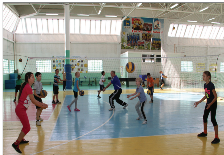
В детско-юношеской спортивной школе «Фортуна» идёт тренировка по волейболу.