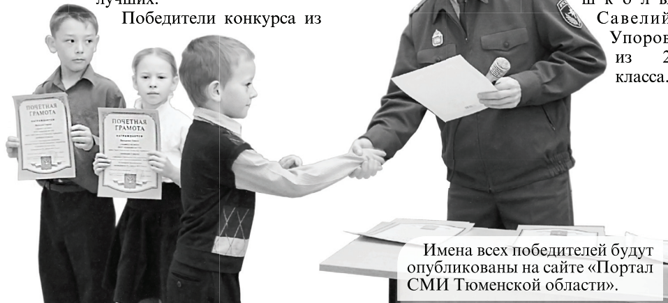
Имена всех победителей будут опубликованы на сайте «Портал СМИ Тюменской области».