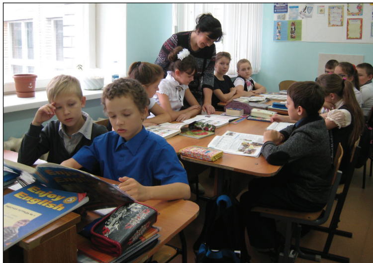
• Учащиеся 5б класса Аромашевской средней школы обучаются по программе новых стандартов.

Информация обо всех нововведениях, связанных с переходом школы на стандарты второго поколения, размещается на школьном сайте.