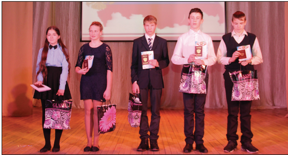
• «Принимая почётное звание гражданина России, клянёмся укреплять авторитет своей страны!»

В завершении мероприятия ведущие пожелали всем любить свою родину, беречь её, ведь будущее малой родины и страны – в наших руках, и мы должны помнить об этом.