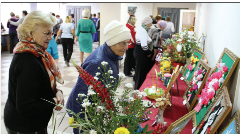
• Выставка художественно-прикладного искусства вызвала большой интерес.

Зрители тепло восприняли музыкальные номера хора «Россианка» из Аромашево, вокальных групп «Рябинушка» из Кротово, «Сударушка» из Слободчиков, «Калина» из Русаково, «Журавушка» из Кар-