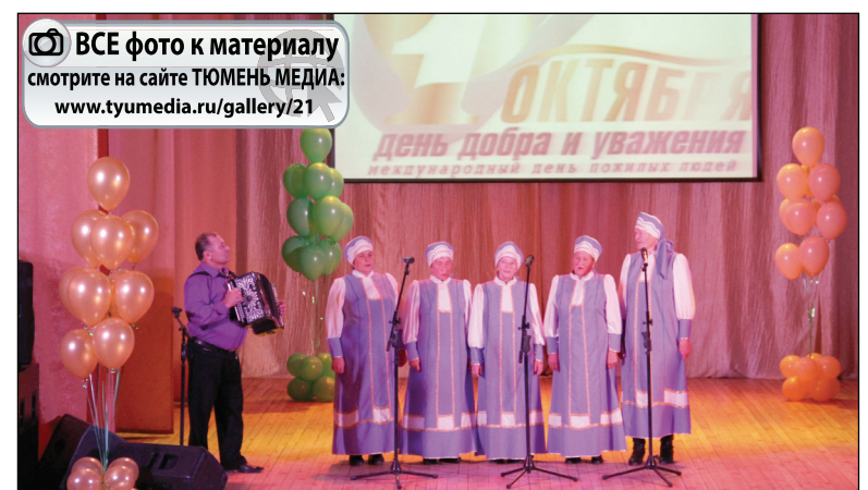
• Конкурсанты подарили зрителям много ярких выступлений.