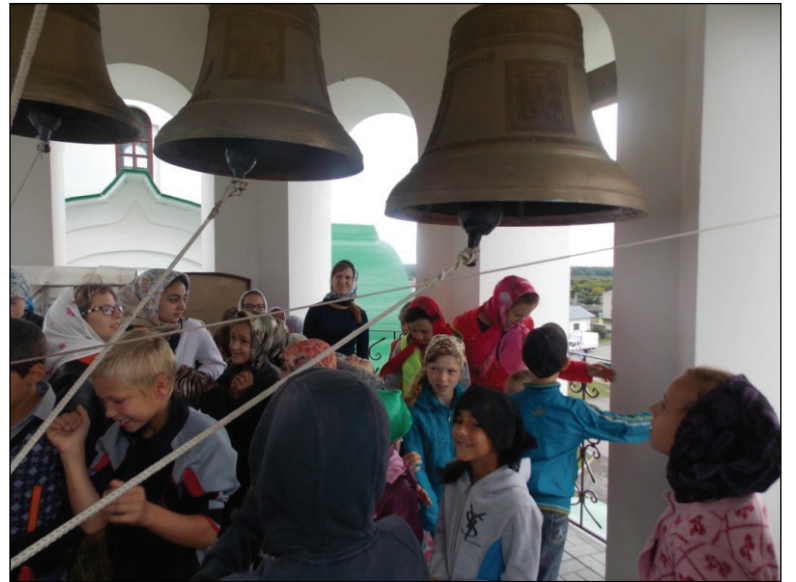
• Дети из «ПаРус» были рады выпавшей возможности побывать на колокольне аромашевской церкви.