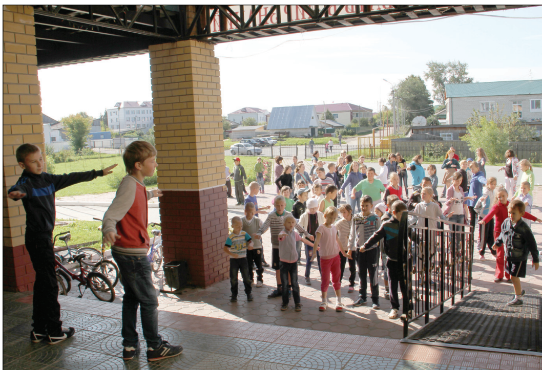
• Каждое утро в детском лагере при Аромашевской школе начиналось с зарядки.

Лето 2015 года будет у всех ассоциироваться с разными событиями: кто-то научился плавать, кто-то съездил отдохнуть, кто-то собрал очень много грибов, кто-то и вовсе не отдыхал, а только работал. Для сотни аромашевских ребятишек этот август запомнится помимо прочего и тремя неделями отдыха в пришкольном лагере.