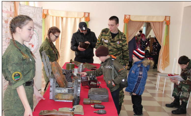
• Ребята с любопытством рассматривали экспонаты.