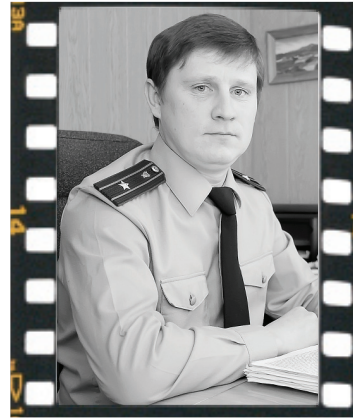
Прокурор Аромашевского района

По Году кино хочу сказать: наш президент если за что-то берётся, значит, результат будет, и объявленный им Годом российского кино 2016 год принесёт свои плоды в отечественном кинематографе.