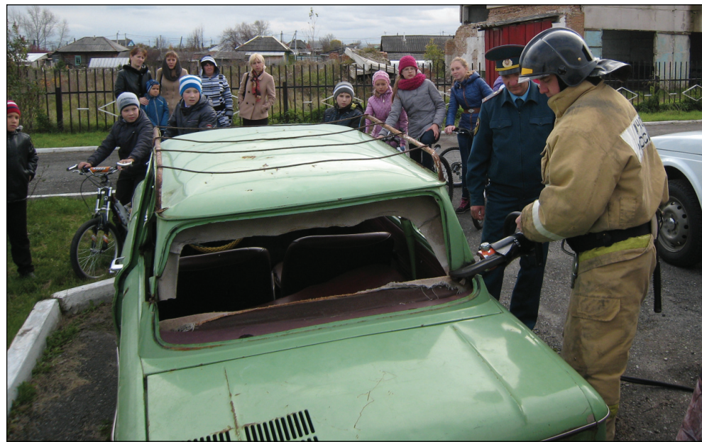
• Профессиональный спасатель показал ребятам, как вывозят людей из автомобиля, попавшего в ДТП.

Завершилась встреча коллективным фото Аромашевских спасателей и юных инспекторов дороги.