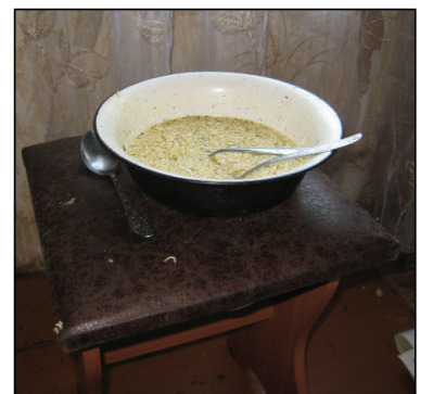
• «Полноценный» детский обед из лапши быстрого приготовления.

Пока ведутся взрослые разговоры, двухлетний сынишка «виновницы торжества» подходит к стульчику, где стоит лапша, и начинает хлебать холодную похлёбку. Поев, кладёт ложку рядом с посудой и отправляется обратно на диван. Пообедал... Никого из домочадцев не волнует тот факт, что он проголодался, хотя на часах самое время, чтобы на столе появился обед. Роди-