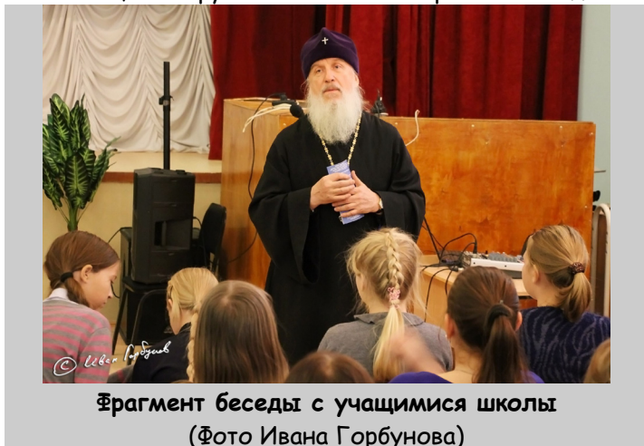
Фрагмент беседы с учащимися школы

Отец Димитрий является Ректором Тобольской духовной семинарии. С ним приезжали его ученики - учащиеся Тобольской православной гимназии из 6,7,8,9,10 классов. Они исполняли церковное песнопение на греческом и русском языках. На конкурсе православных гимназий они стали одними из лучших, им предоставили возможность выступить в Москве.