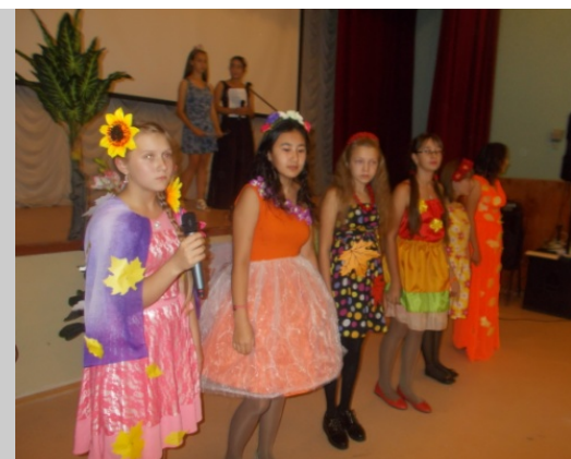
Участницы конкурса «Мисс Осень»

Организатором был 8 «а» класс, который подготовил концертно-развлекательную программу. Также все присутствующие во главе с жюри выбирали «Мисс Осень». Оценивалось представление участницы, ее костюм и кулинарное изделие.