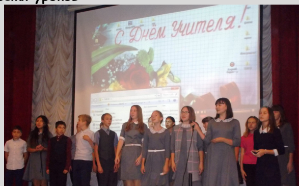
Фрагменты праздничного концерта для учителей нашей школы